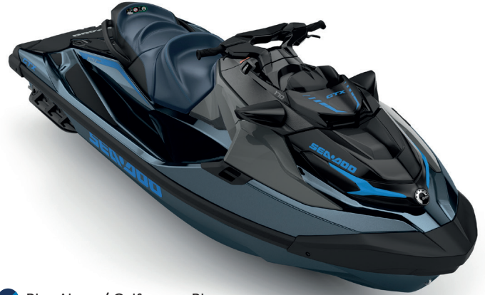
Blue Abyss / Gulfstream Blue